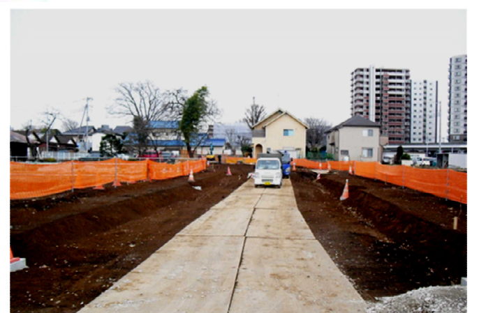
着々と進む新座駅北口土地区画整理事業